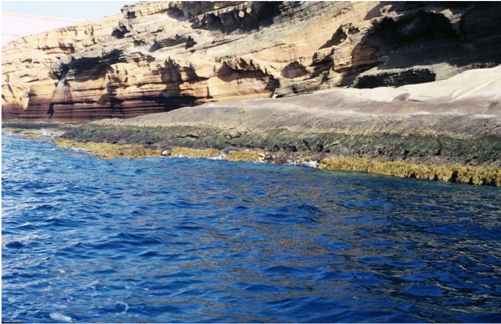
Costa baja. Habitat: 2030. Estructura rocosa o de materiales compactados, generalmente de inclinación baja, con proyección similar en los fondos inmediatos.