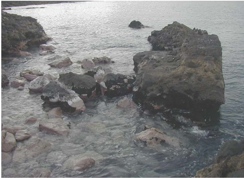
Bloques artificiales. Habitat: 2042. Materiales de cemento, como prismas, tetrápodos, diques, etc., o natural, como rocas de escolleras, dispuestos de forma artificial.