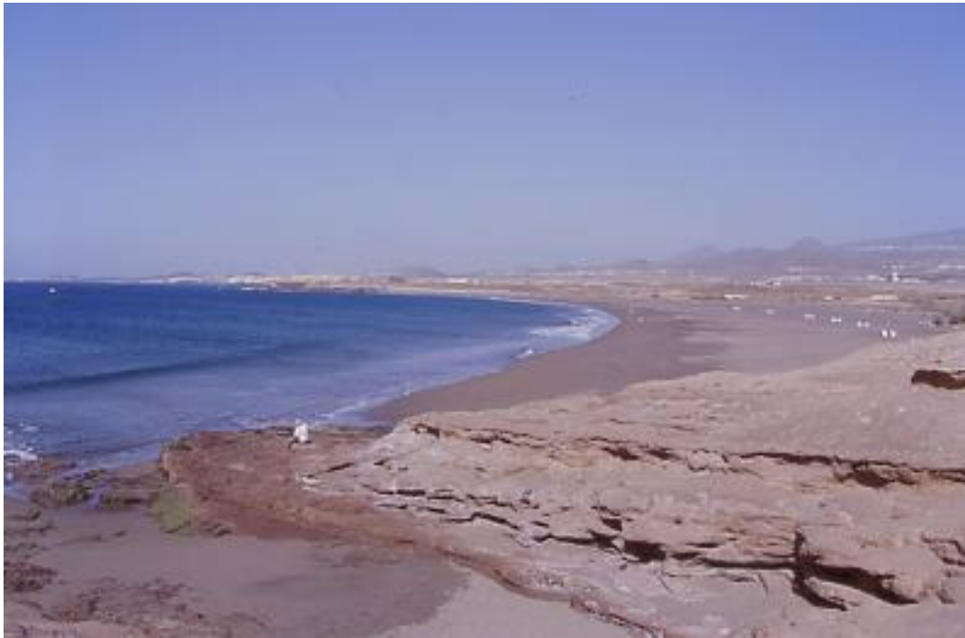
Playa artificial. Habitat: 2064. Playa construida con arena procedente de otros lugares y extendida sobre el litoral. Es frecuente la mezcla de estos materiales con la arena nativa en proporci3n variable.