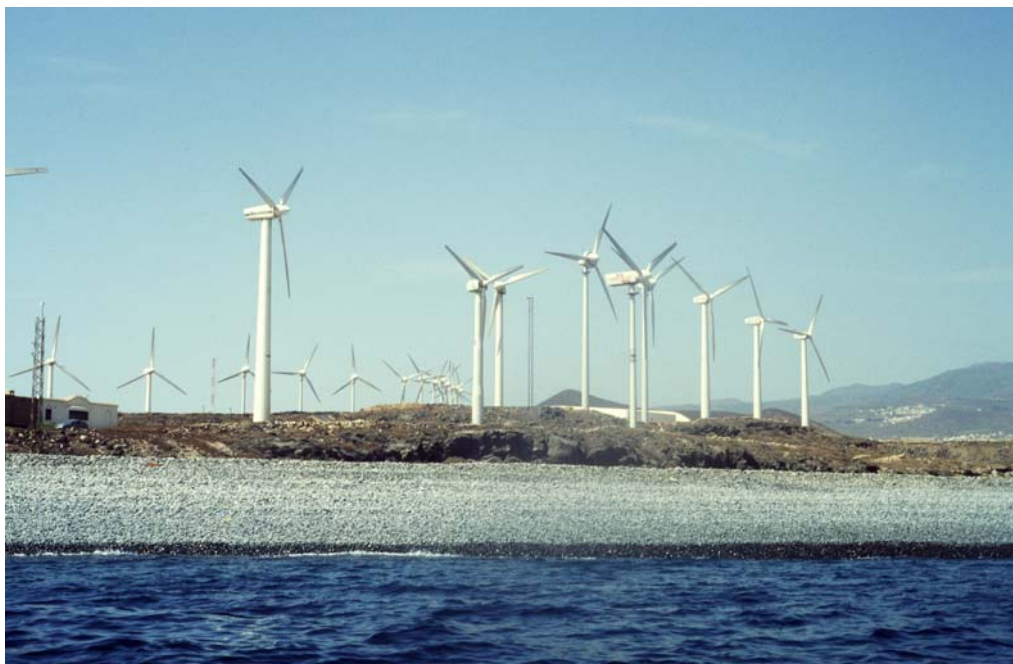
Playa de arena. Habitat: 2063. Playa formada por materiales de estructura granular fina.